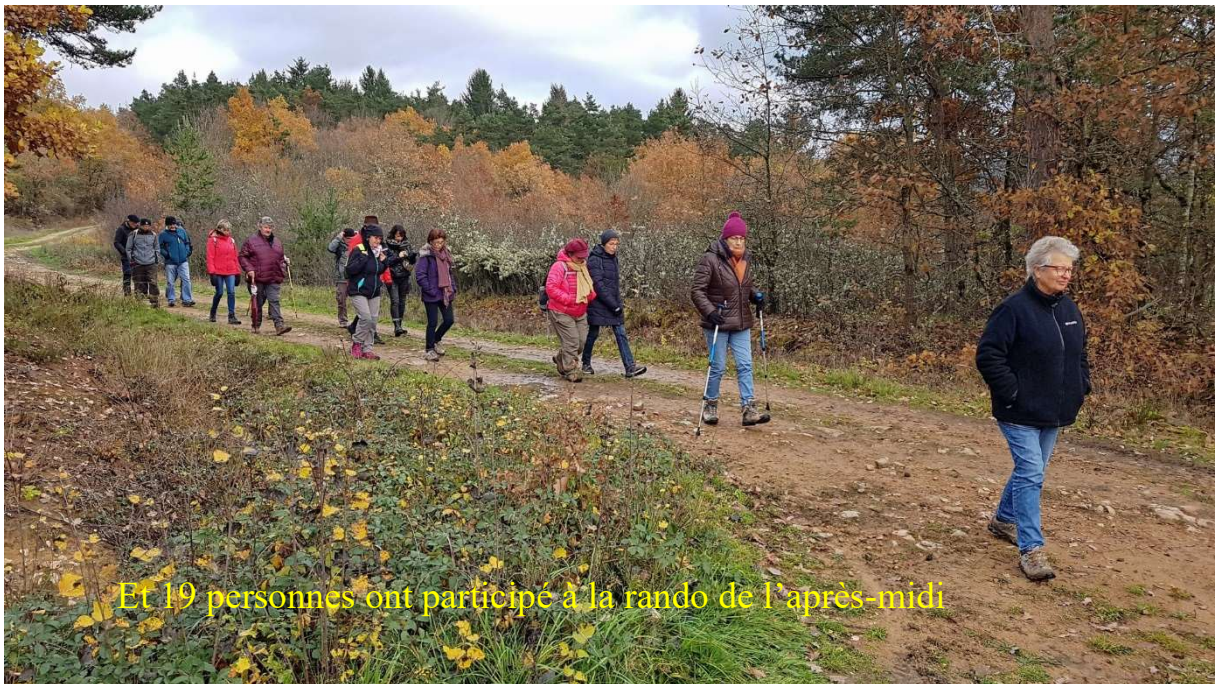
Et 19 personnes ont participé à la rando de l'après-midi