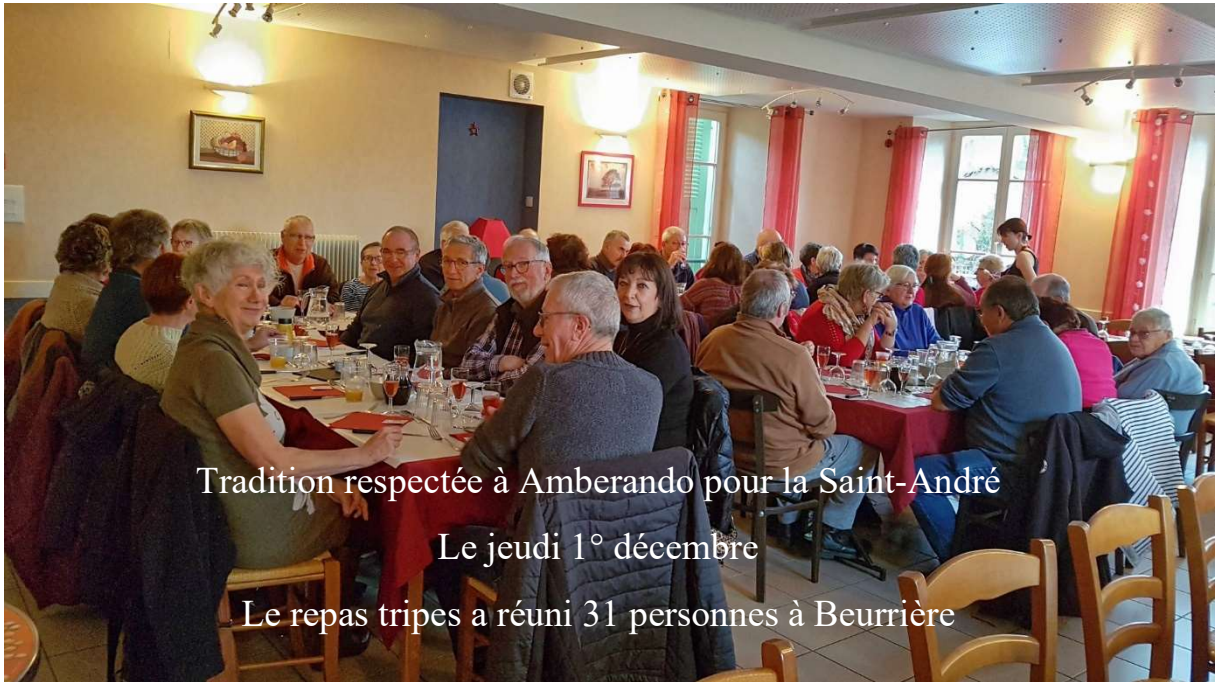
Tradition respectée à Amberando pour la Saint-André Le jeudi 1 o décembre Le repas tripes a réuni 31 personnes à Beurrière